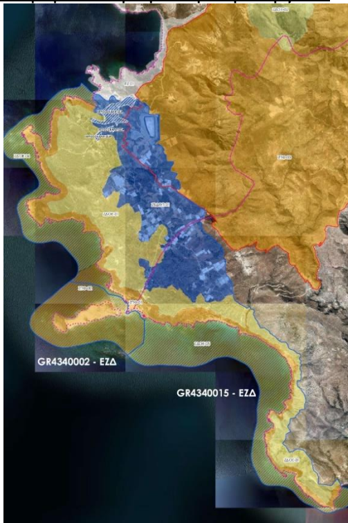
Απόσπασμα Χάρτη ΕΠΜ