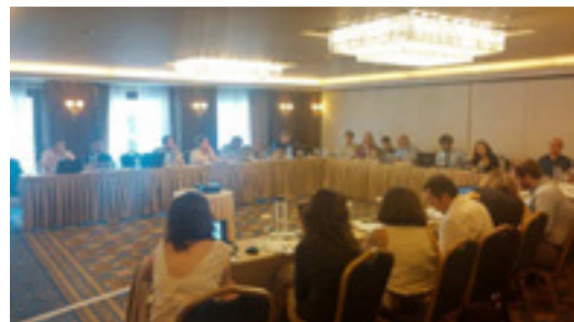
Ο Σ.Ε.Μ.Π.Χ.Π.Α. στην 2η συνάντηση των εταιρών του έργου στην Αθήνα, 6-7/7/2016