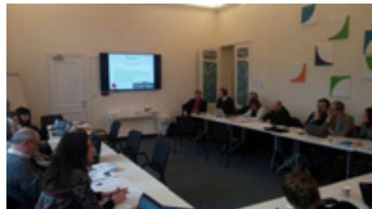
Ο Σ.Ε.Μ.Π.Χ.Π.Α. στην 1η συνάντηση των εταιρών του έργου στις Βρυξέλλες, 22-23/2/2016.

Για περισσότερες πληροφορίες, οι ενδιαφερόμενοι μπορούν να ανατρέξουν στην ιστοσελίδα του έργου www.intenssspa.eu